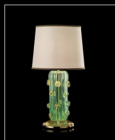
MENTA > 112