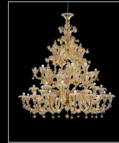
TRIONFO > 6