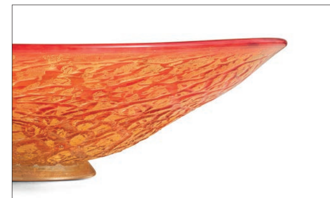
ROSSO ORO RED ALL GOLD