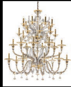
GASPAR > 66