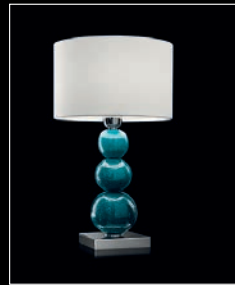
BOLBE > 114