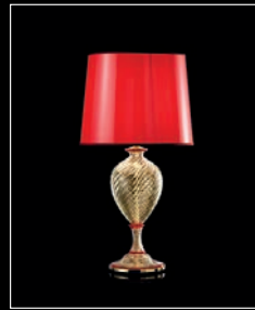
ERITHEA > 101