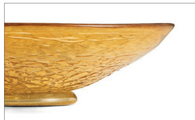
AMBRA ORO AMBER ALL GOLD