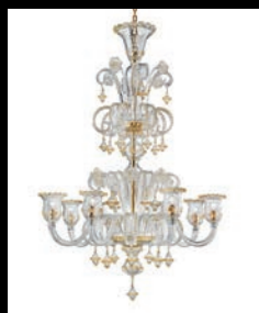
HUMBERTUS > 76