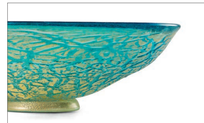
TURCHESE ORO TURQUOISE ALL GOLD