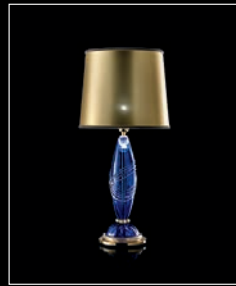
ELETTRA > 105