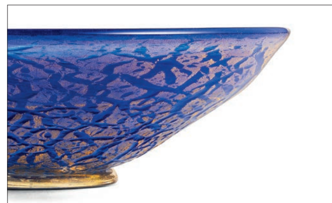
BLU ORO BLUE ALL GOLD