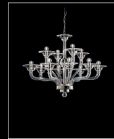
PLANETA > 84