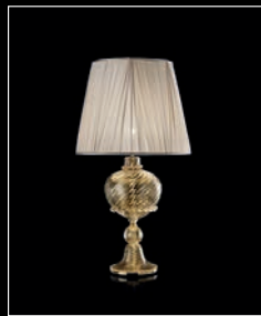
EGLE > 103