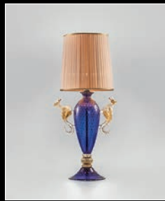
AEGON > 94