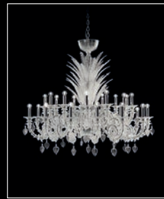
ANANAS > 70