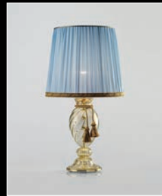
CERSEI > 102