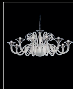
MIKKELI > 85