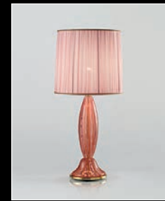
PRONOA > 108