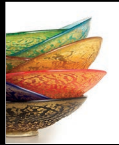
GHIACCIO > 116