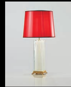
PSMATE > 104