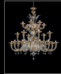
SERSE > 54