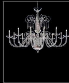
EDUARDUS > 82