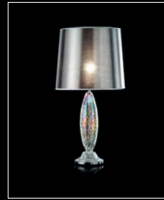
ESIONE > 110