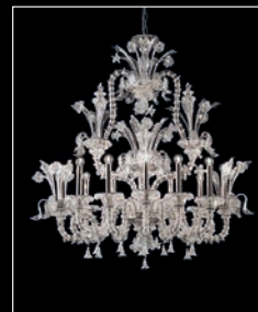
MOONLIGHT > 62