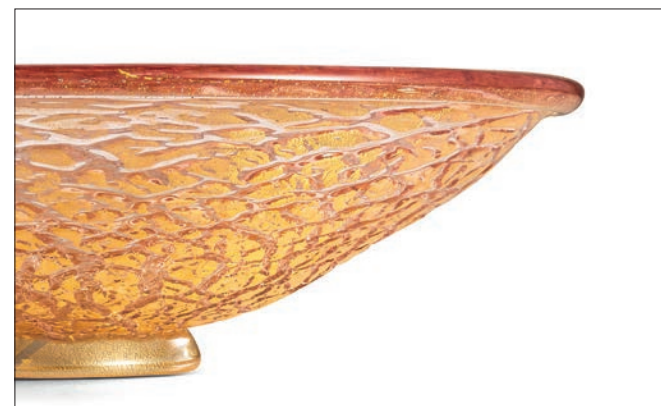
ROSA ORO PINK ALL GOLD