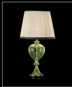
ESPERA > 100