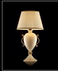
AMATEIA > 98