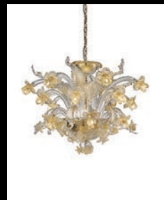
AMELIE > 28