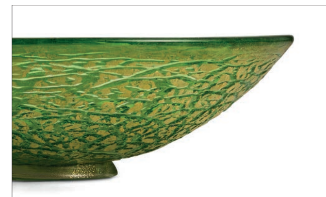
VERDE ORO GREEN ALL GOLD