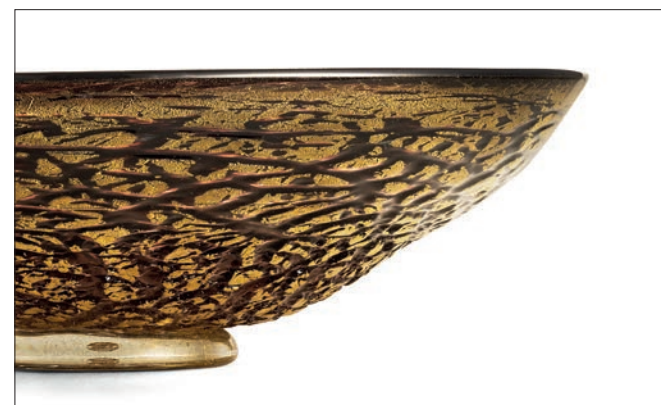
AMETISTA ORO AMETHYST ALL GOLD