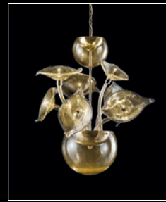
HIBISCUS > 18