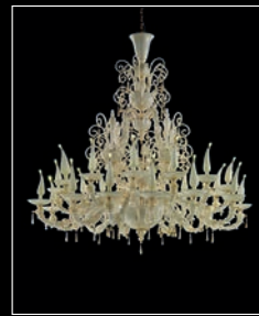
ARCHIMEDE > 58