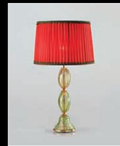
MOREA > 113