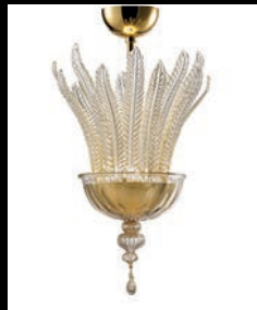
ASTORIA > 38