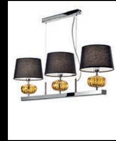
SAVVA > 90