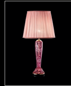
RODEIA > 106