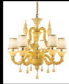
ERRICO > 74