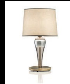
SANSA > 92