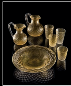
FANTASY > 124