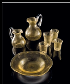
IMBRIAGO > 122