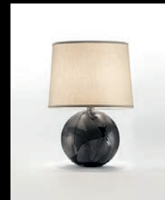
URANIA > 115